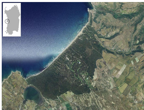
Figura 1 – Foto aerea di Is Arenas (OR). Figure 1 – Aerial photography of Is Arenas (OR).

L'obiettivo della ricerca è stato quello di analizzare il campo dunale di Is Arenas (figura 1) con la finalità di evidenziare le correlazioni tra i caratteri fisici della spiaggia, in particolare della duna e le risposte della flora e delle fitocenosi presenti, attraverso l'integrazione di dati morfologici, sedimentologici, floristici ed ecologici. Inoltre, il posizionamento di una rete di aree permanenti all'interno del campo dunale consentirà di realizzare un continuo monitoraggio dell'area e di acquisire numerosi dati utili a fini gestionali.