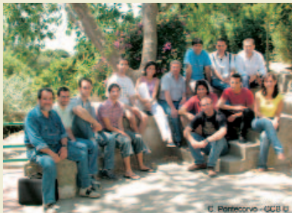
Cagliari. Foto del gruppo Virtualorto